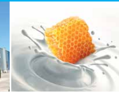
MILCH & HONIG